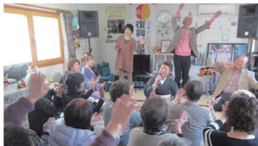
【元気になる講演会】