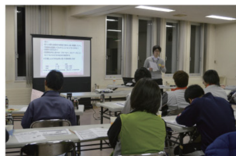
【ボランティア養成講座】