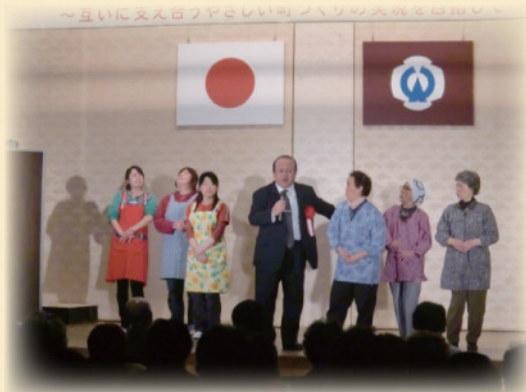
【大槌町社会福祉大会の様子】