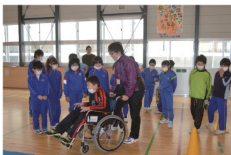
【キャップハンディ体験学習】