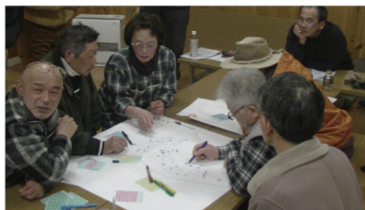
【住民支え合いマップ作成】