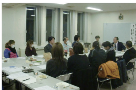
【おおつち未来のかけはし養成塾】