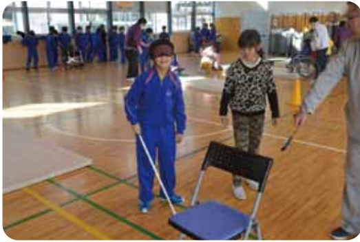
キャップハンディ体験学習