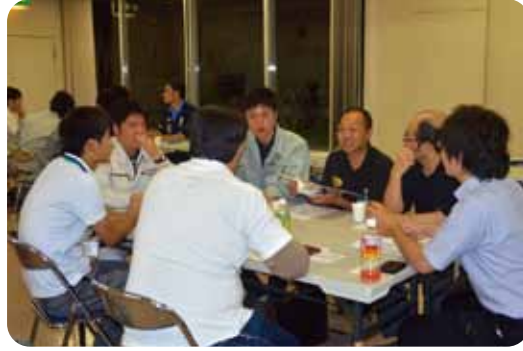
未来のかけはし養成塾