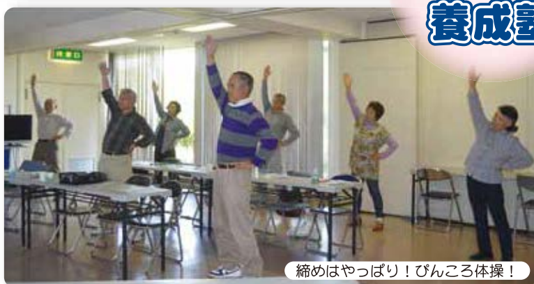
締めはやっぱり！ぴんころ体操！