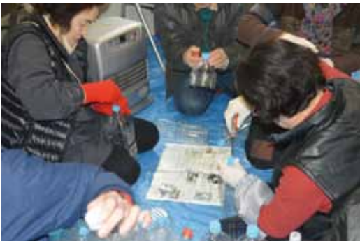
◀作業に取り組むメンバー

イベント当日の朝は、強風で雪が降る悪天候だったため中止も考えましたが、これまでの努力が報われたのか、天候も回復したため、準備に取り掛かりました。大学生などのボランティアも多く参加し、会員の皆さんとペットボトルを並べていきましたが、風で何度も飛ばされてしまいます。それでもイベントの開始時刻までに全て並べることができ、参加者を迎えることができました。