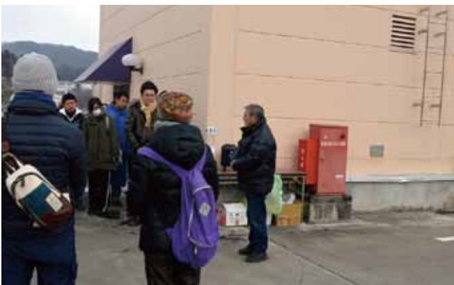
実行委員長からのあいさつ