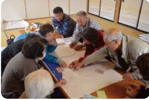
住民支え合いマップづくり