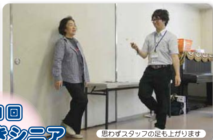
思わずスタッフの足も上がります