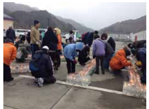
イベント当日準備

イベント当日の朝は、強風で雪が降る悪天候だったため中止も考えましたが、これまでの努力が報われたのか、天候も回復したため、準備に取り掛かりました。大学生などのボランティアも多く参加し、会員の皆さんとペットボトルを並べていきましたが、風で何度も飛ばされてしまいます。それでもイベントの開始時刻までに全て並べることができ、参加者を迎えることができました。