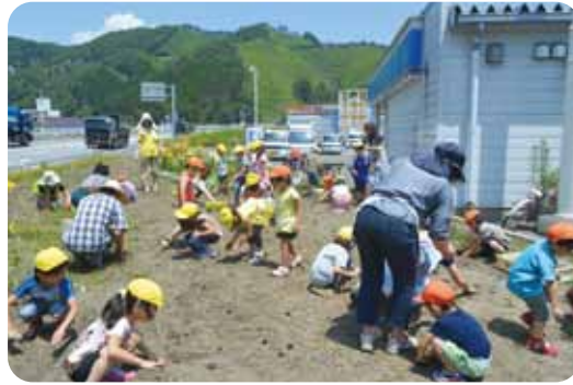
花いっぱいプロジェクト