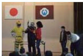
釜石警察署生活安全課・大槌交番署員による寸劇

大槌交番署員による手作り感あふれるステージは、参加者に笑いと親近感を与えてくれました。