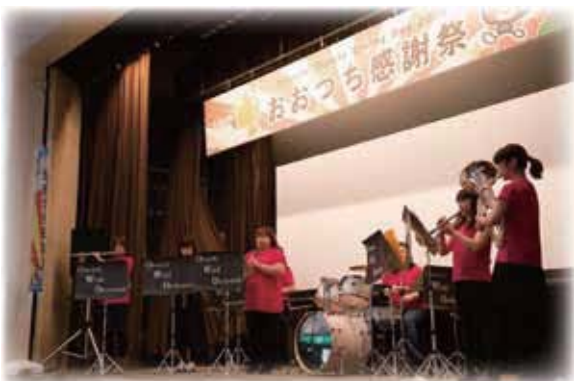
大槌ウインド・オーケストラ