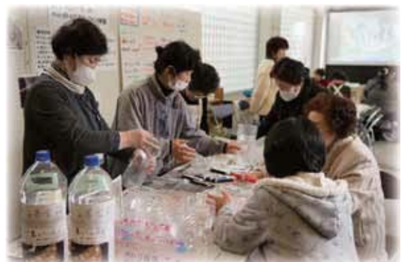
大槌町NPO・ボランティア団体連絡協議会