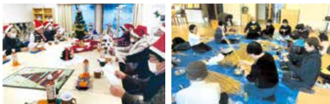
柱内地区お茶っこの会 (クリスマス忘年会)