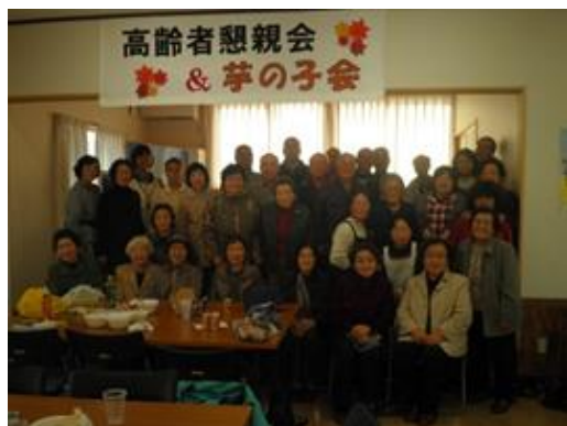
沢山地区お茶っこの会