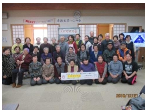
赤浜地区お茶っこの会

【お問い合わせ先】 岩手県共同募金会 大槌町共同募金委員会 (大槌町社会福祉協議会内) ☎0193-41-1511