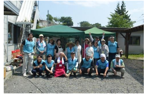
みなさん暑い中お疲れ様でした!!