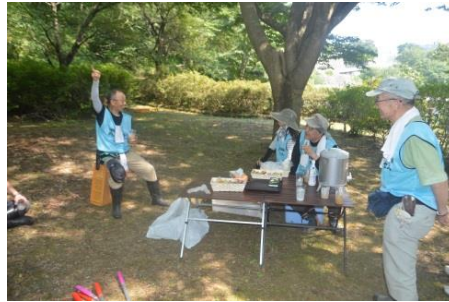
休憩時間は大事な情報共有の場