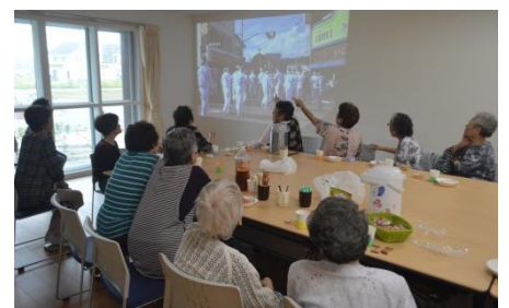
③ 大槌のなつかしい風景の鑑賞会