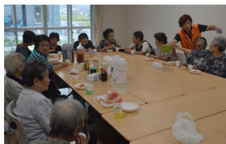
② みんなでお茶っこ