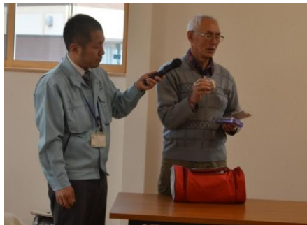
自治会長から防災備蓄品の紹介