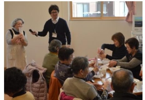
炊き出し袋で作ったご飯の食べ方指導