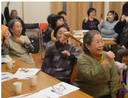
脳トレ体操で頭をスッキリ

今一度、家族やご近所同士で、防災について理解を深める機会を設け、災害への備えを行っていきましょう。