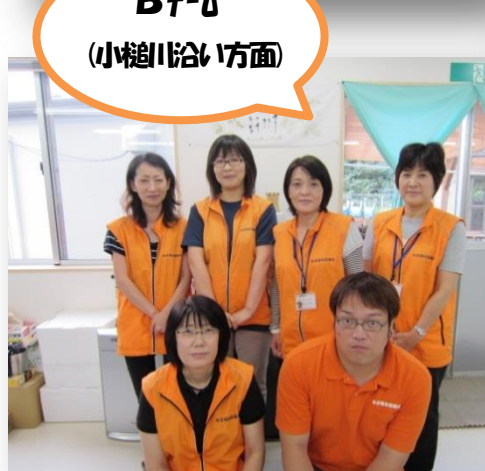
Bチーム (小槌川沿い方面)