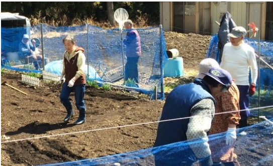
(小籠2・17 仮設の皆さん)

春の陽気に誘われ、共同の野菜畑に集まって農作業中の仮設の皆さんとお会いしました。和気あいあいとした作業の様子から日頃の暮らしぶりが窺われ、野菜の他にもいろいろな収穫が期待できそうな心温まる光景でした。