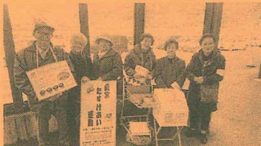
12/23 民生委員 OB 会の皆さま

寒い一日でしたが、みなさん大きな声で「歳末たすけあい募金のご協力をお願いします」と呼びかけをしました。大きな買い物の荷物をかかえた女性、ベビーカーの親子、高校生、お仕事中の男性の方、病院帰りの高齢者、皆さんからたくさんのご協力が寄せられました。