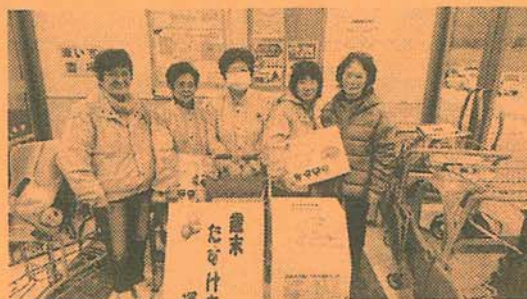
12/18 大槌町赤十字奉仕団の皆さま