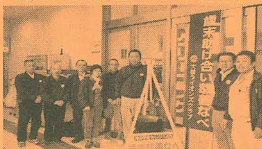
12/20 大槌町ライオンズクラブの皆さま