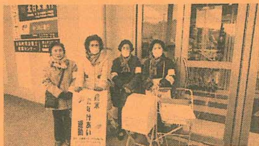
12/11 更生保護女性の会の皆さま

歳末たすけあい運動は、新たな年を迎える時期に、支援を必要とする人たちが、地域で安心して暮らすことができるよう、住民の皆さまの協力を得て、地域で支え合う運動です。今年度も町内のボランティア団体様に協力していただきました。