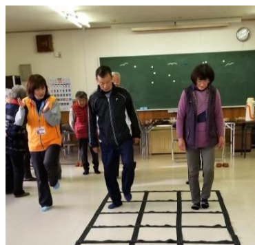
高齢者のサロン活動