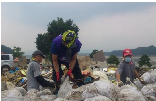
大規模災害時のボランティア活動支援