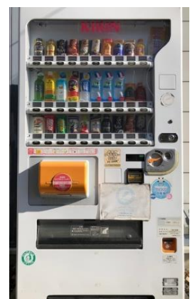
大槌町社協前に設置