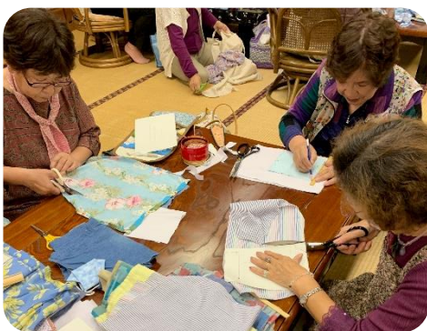
マスク生地のカットの様子 ～大槌町連合婦人会～