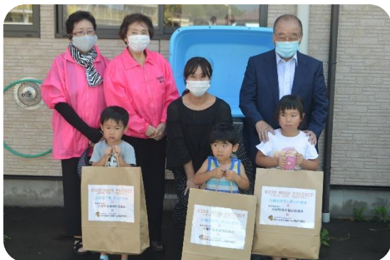
おおつちこども園