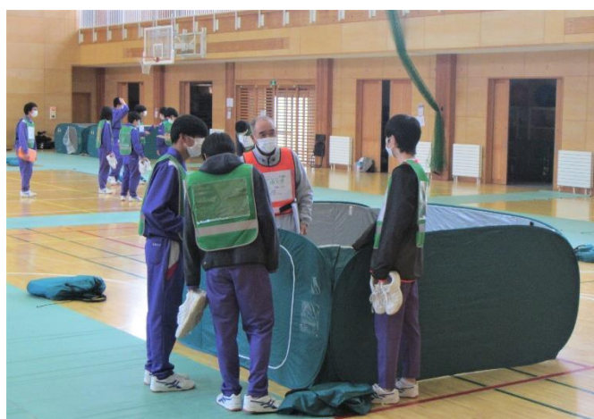
ファミリールームの設置