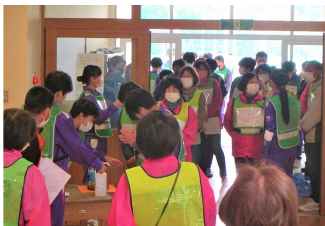
避難者受付・誘導

災害へ備えて、防災は日常からの心がけが大切です。「防災」をテーマにした地域づくりの研修会など、ご要望があれば地区や企業、団体単位で開催することができますので、ボランティアセンターまでお気軽にご相談ください。