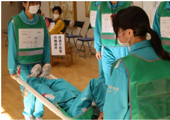
(11/14)避難所設置・運営訓練

防災に関する研修は、自治会・町内会、企業・団体単位で要望に応じて開催することができます。お気軽に大槌町社協ボランティアセンターまでご相談ください。