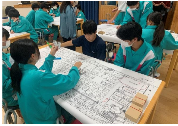
(10/30)避難所運営ゲーム(HUG)