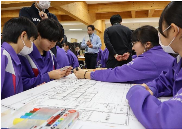
(10/31)避難所運営ゲーム(HUG)

防災に関する研修は、自治会・町内会、企業・団体単位で要望に応じて開催することができます。お気軽に大槌町社協ボランティアセンターまでご相談ください。