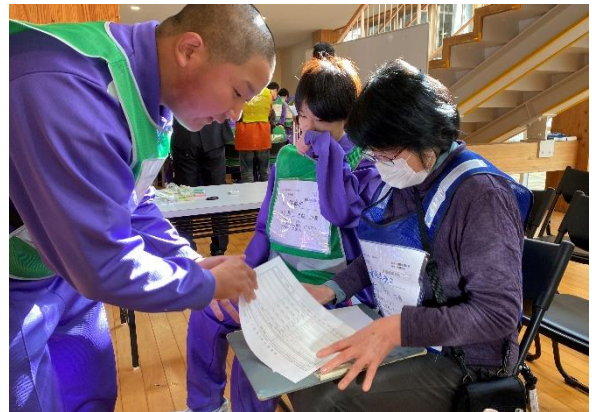
(11/12)避難所設置・運営訓練